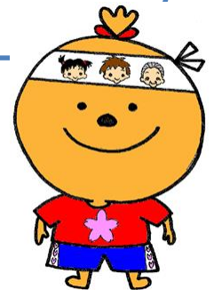
福岡市健康づくり イメージキャラクター 「よかろーもん」